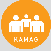
Kamu Arařtırmaları Destek Grubu