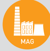
Mühendislik Arařtırma Destek Grubu