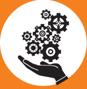
Makine - İmalat