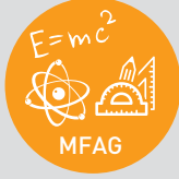
Matematik, Fizik Arařtırma Destek Grubu