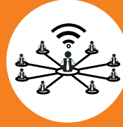
Bilgi ve İletişim Teknolojileri