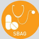
Sađlık Bilimleri Arařtırma Destek Grubu