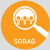
Sosyal ve Beřeri Bilimler Arařtırma Destek Grubu