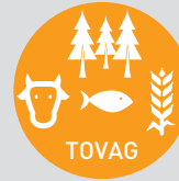
Tarım, Ormanlık ve Veterinerlik Arařtırma Destek Grubu