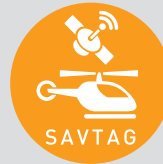
Savunma ve Güvenlik Teknolojileri Arařtırma Destek Grubu