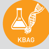
Kimya, Biyoloji Arařtırma Destek Grubu