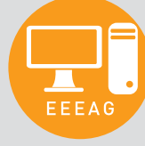
Elektrik, Elektronik ve Enformatik Arařtırma Destek Grubu