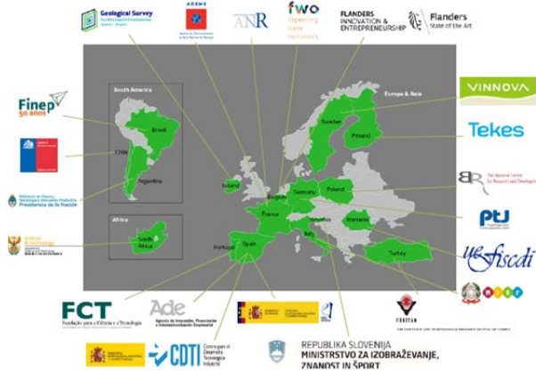
Şekil 1: Fonlayıcı Kuruluşlar ve ülkeleri

Endüstriyel rekabet edilebilirliği güçlendirmek ve dögüsel ekonomiye geçmek için Avrupa'da "ham maddelerle" ilgili Ar-Ge ve inovasyon faaliyetlerinin koordinasyonunu sağlayıp yürütmek amacıyla oluşturulan ERA-MIN-2 ERA-NET Co-fund projesi Ufuk 2020 alt alanlarından "İklim Değişikliği, Çevre, Kaynak Verimliliği ve Ham maddeler" (Climate Action, Environment, Resource Efficiency and Raw Materials)" altında desteklenmektedir. ERA-MIN-2 Projesi 01 Aralık 2016 tarihinde başlamıştır. ERA-MIN-2, onsekiz ülkeden yirmibir fonlayıcı kuruluşun katılımı ile oluşturulmuş bir konsorsiyum olup, ham maddeler alanındaki Ar-Ge projeleri için 1 Şubat 2017'de ortak çağrı açılacaktır. Fonlayıcı kuruluşlar ve ülkeleri aşağıdaki resimde belirtilmiştir.